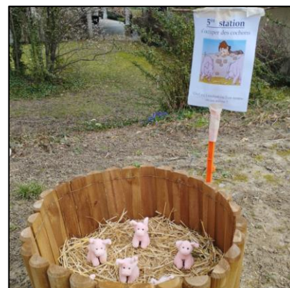
Rallye - Station 5 « S'occuper des cochons » : Quel est l'endroit où l'on rentre en soi-même ?

Cette édition a une nouvelle fois permis à tout un chacun de passer un moment convivial, montrant que le sacrement du Pardon peut être un temps de joie à partager pour s'alléger et repartir le cœur serein, loin de la dimension parfois plus punitive qu'il peut revêtir.