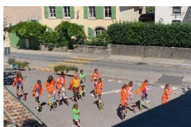
Buvette du foot

Soit 108 locations (107 en 2022, 68 en 2021, 38 en 2020, 143 en 2019, 140 en 2018).