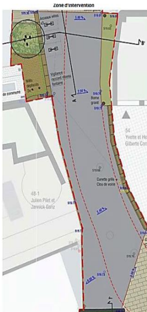
Zone « Maison de Commune »

Toute la zone 1 sera terminée pour le 20 septembre 2024