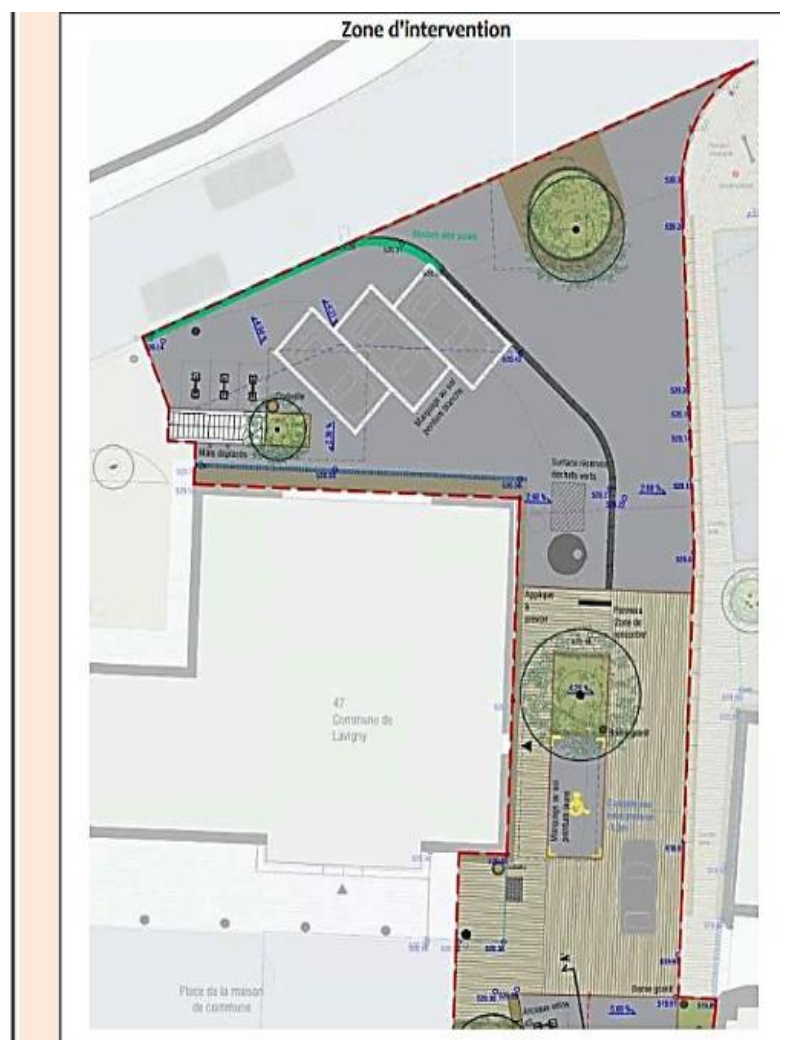
Zone « Epicerie »