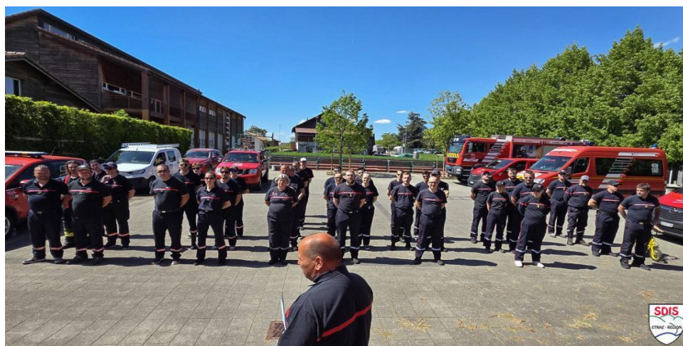
Concours régional des sapeurs-pompiers volontaires à Lavigny – avril 2026

Le SDIS intervenu à 5 reprises contre 7 en 2024 dans notre village.