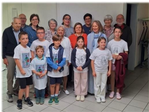
Le comité du Groupe Missions avec les enfants, de Rolle et St Prex, du nouveau groupe : Enfance missionnaire

Le Groupe Missions vous propose de participer à notre prochain